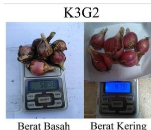
Gambar 4. Perbandingan Berat Basah dan Berat Kering Bawang Merah dengan Perlakuan K3G2 (Kompos Daun Kelapa Sawit 45 gram/polybag dan NPK 16.16.16 1,15 gram/polybag)

serta pupuk K memberikan peran positif dalam menyediakan hara khususnya unsur kalium yang dibutuhkan untuk pertumbuhan umbi bawang merah.