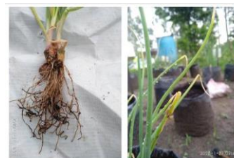
Gambar 2. Tanaman Terserang Layu Fusarium dan Tanaman Terserang Ulat Daun

anorganik dapat meningkatkan pH, KTK tanah, kandungan NPK, kation yang dapat dipertukarkan seperti: Ca, Mg, K, dan Na. Selain itu juga dapat meningkatkan pertumbuhan dan produksi tanaman.