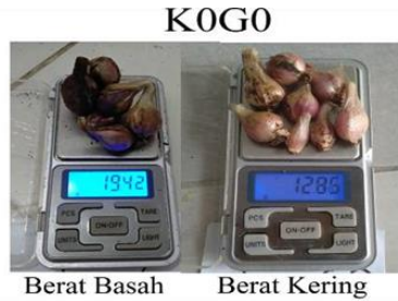
Gambar 3. Perbandingan Perlakuan Berat Basah dan Berat Kering Bawang Merah Tanpa Perlakuan Kompos Daun Kelapa Sawit dan NPK 16.16.16

rata-rata 448 gram untuk empat tanaman bawang merah.