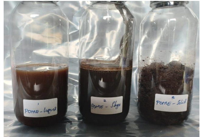
Gambar 1. Jenis Sampel POME: 1. POME-Liquid; 2. POME-Sluge; 3. POME Solid

sampel diambil secara representatif dari saluran buang POME sisa proses di Reaktor Methane Capture dan dilakukan tiga kali ulangan untuk memastikan reproduibilitas data.