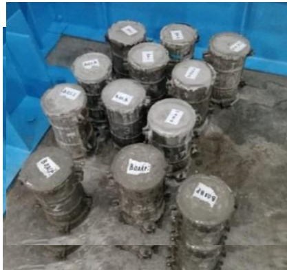
Gambar 3. Benda Uji

Proses selanjutnya melakukan pembuatan benda uji setelah seluruh material disiapkan dan ditimbang sesuai proporsi dalam desain campuran beton. Setelah adukan beton siap, campuran dituangkan ke dalam cetakan standar. Cetakan beton yang digunakan yaitu cetakan silinder 15 cm x 30 cm.