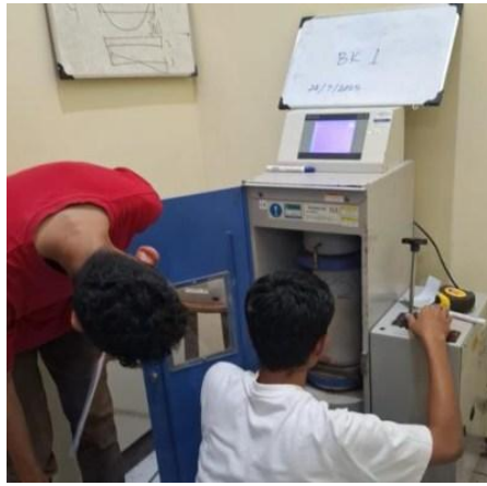
Gambar 4. Proses pengujian Kuat Tekan Beton

Setiap variasi dimensi campuran diuji dengan tiga benda uji untuk mendapatkan hasil yang lebih representatif dan dapat dibandingkan secara statistik. Hasil dari pengujian ini kemudian dianalisis untuk melihat pengaruh ukuran serat aluminium terhadap nilai kuat tekan beton.