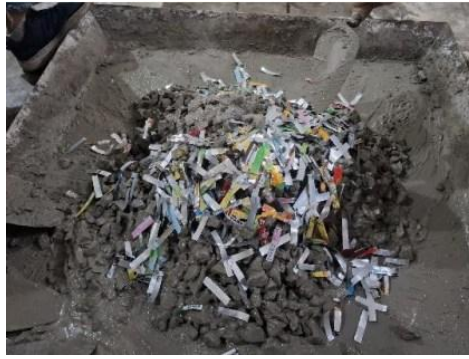
Gambar 2. Campuran Beton

Empat variasi campuran beton disiapkan dalam penelitian ini, yaitu beton kontrol tanpa serat dan tiga campuran dengan serat aluminium berukuran berbeda. Untuk menjamin homogenitas campuran, serat aluminium dicampurkan bersama agregat sebelum pencampuran dengan semen dan air dilakukan.