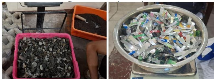
Gambar 1. Material yang digunakan

Limbah kaleng aluminium dikumpulkan dari sumber limbah domestik maupun industri. Kaleng aluminium kemudian dipotong secara manual menggunakan alat potong khusus menjadi serat dengan variasi lebar 0,2 cm, 0,5 cm, dan 0,8 cm, serta panjang 5 cm. Serat aluminium yang telah dipotong dibersihkan dari kotoran, debu, dan minyak agar tidak mengganggu proses pencampuran beton. Selanjutnya, serat disimpan dalam wadah tertutup untuk mencegah kontaminasi sebelum digunakan.