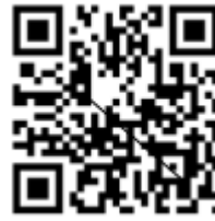
Gambar 1. Contoh QR Code

banyak digunakan untuk akses data cepat di berbagai bidang. Selain itu, kapasitas penyimpanan data QR Code juga lebih besar dibandingkan dengan barcode konvensional. Contoh QR Code yang sering digunakan dapat dilihat pada gambar 1.