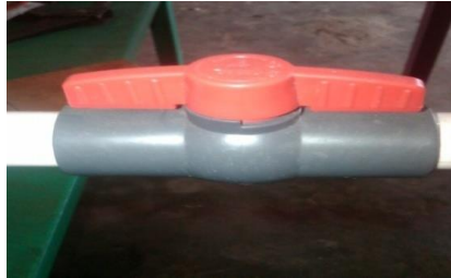
Gambar 3. Globe Valve