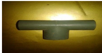
Gambar 5. Penyambung T