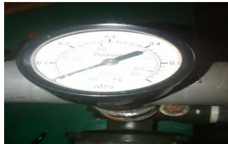
Gambar 6. Pressure Gauge

Satuan ukuran yang umum digunakan pada pressure gauge adalah Bar, psi, Mpa, dan kg/cm 2 , gambar 6 menunjukkan sebuah pressure gauge yang umum digunakan. [7]