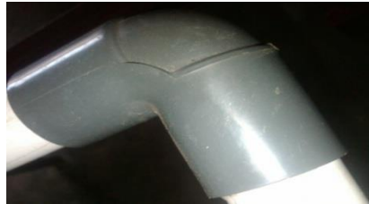
Gambar 4. Elbow