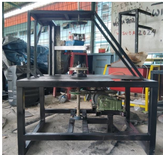
Gambar 3.1 Mesin Pengupas Kulit Nangka Muda

Mesin Pengupas Kulit Nangka Muda yang digunakan dalam proses penelitian dapat dilihat pada Gambar 3.3 dan spesifikasi dari Pengupas Kulit Nangka Muda dapat dilihat pada Tabel 3.1 dibawah ini.