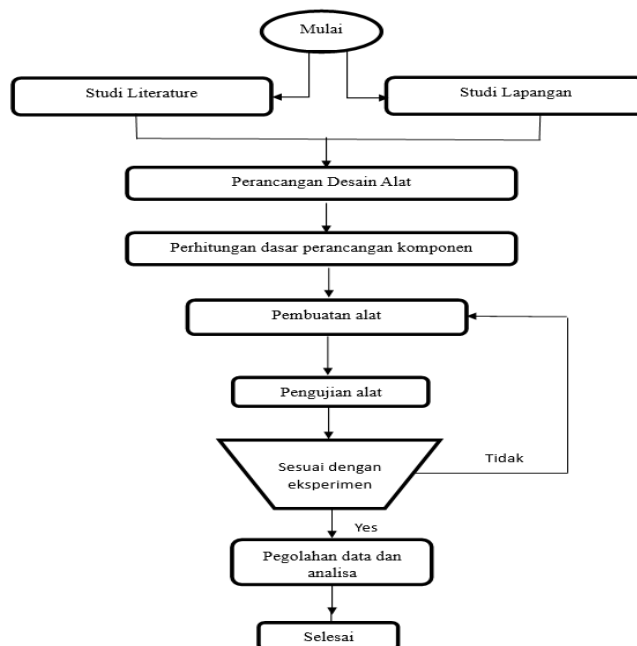
Gambar 1. Flowchart Metodologi Penelitian

Perancangan penelitian ini dilakukan dengan berbagai langkah kerja yang sistematis supaya mendapatkan hasil yang optimal. Langkah kerja penelitian merupakan serangkaian prosedur dalam melakukan penelitian yang terstruktur secara tersusun agar tujuan dari penelitian bisa tercapai dengan baik. Adapun langkah-langkah yang digunakan dalam penelitian ini dibuat dalam flowchart penelitian.