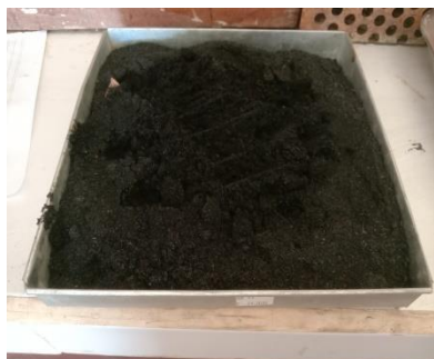
Gambar 1. Abu Sawit

geopolimer yang terjadi [6]. Kandungan senyawa abu sawit ini diuji di Laboratorium Balai Riset Industri Padang, Sumatra Barat.