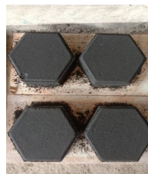
Gambar 3. Sampel Paving Block

Perbedaan hasil ini disebabkan dalam jumlah kandungan semen yang bereaksi, semakin banyak semen maka ikatan antar butiran akan semakin kuat untuk variasi penambahan PCC 30% yang mencapai 25,81 MPa. Tetapi berbeda untuk hasil variasi tambahan OPC. Pada penambahan OPC 30% mengalami penurunan menjadi 22,27 MPa. Penambahan OPC maksimum pada OPC 25% dengan hasil 23,82 MPa. Hasil ini berpengaruh pada batas penambahan kandungan OPC dalam reaksi geopolimer terhadap air gambut yang digunakan [7]. Kandungan semen yang dipakai sangat tergantung pada jumlah air/ FAS (Faktor Air semen) yang dipakai waktu proses hidrasi berlangsung [8]. Kadungan senyawa Fe, Mn, dan Zn pada air gambut akan memutus ikatan geopolimer yang terjadi. Disatu sisi, kandungan OPC dan PCC yang terkandung akan membantu proses ikatan dan panas hidrasi yang terbentuk pada campuran paving block geopolimer itu sendiri.