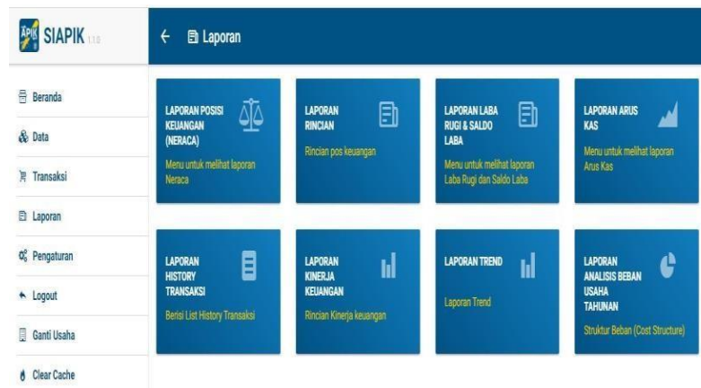
Gambar 1. Tampilan Menu Laporan Aplikasi Siapik

Sistem Informasi Pencatatan Informasi Keuangan (SIAPIK) merupakan sebuah software akuntansi digital yang dirancang oleh Bank Indonesia (BI). Aplikasi ini khusus ditujukan untuk UKM untuk membantu menyusun laporan keuangan yang komprehensif dan akurat. Aplikasi SIAPIK menghasilkan beberapa jenis laporan keuangan: laporan laba ditahan, laporan laba rugi, neraca (laporan posisi keuangan), dan laporan arus kas. Semua output laporan keuangan dari aplikasi ini telah memenuhi standar akuntansi. Aplikasi Siapik memiliki beberapa fitur, yaitu: 1) Jurnal penerimaan kas; 2) Jurnal pengeluaran kas ; 3) Buku Besar, 4) Neraca; 5) Laporan Laba Rugi; 6) Master data; 7) Info Aplikasi; 8) Info Pengguna; 9) Aktifkan Petunjuk; 10) Backup Database; 11) Restore Data base; 12) Ganti user. Aplikasi SiApik dirancang untuk menyusun berbagai komponen laporan keuangan secara komprehensif.