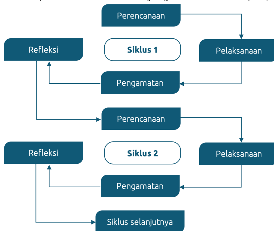
Gambar 1. Siklus Penelitian Tindakan Kelas

Model Penelitian Tindakan Kelas yang digunakan pada penelitian ini berpedoman pada Arikunto, dkk dalam (Junita, et.al, 2020) yang terdiri dari empat tahapan yaitu (1) perencanaan; (2) pelaksanaan; (3) pengamatan; dan (4) refleksi. Penelitian ini terdiri dari dua siklus, di mana setiap masing-masing siklus terdiri dari empat pertemuan dengan tiga kali pelaksanaan tindakan dalam proses pembelajaran diikuti dengan satu kali ulangan harian. Siklus dalam penelitian tindakan kelas merupakan kegiatan yang berlangsung secara berkesinambungan, penelitian dapat dihentikan apabila telah mencapai kriteria keberhasilan yang telah ditentukan (Sari, et.al, 2023).