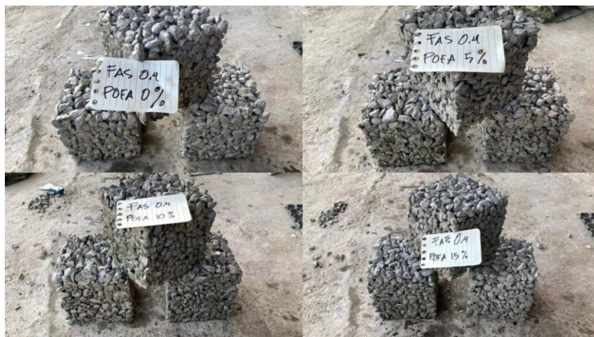
Gambar 4. Sampel Kubus Beton Porous Substitusi POFA Terhadap Berat Semen