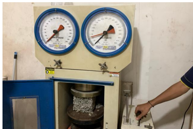
Gambar 3. Pengujian Kuat Tekan Beton

Kekuatan tekan beton dipengaruhi oleh berbagai faktor, termasuk kekuatan agregat, kekuatan semen, dan kekuatan ikatan antara semen dan agregat. Pengujian kekuatan tekan beton dihitung menggunakan rumus berikut :