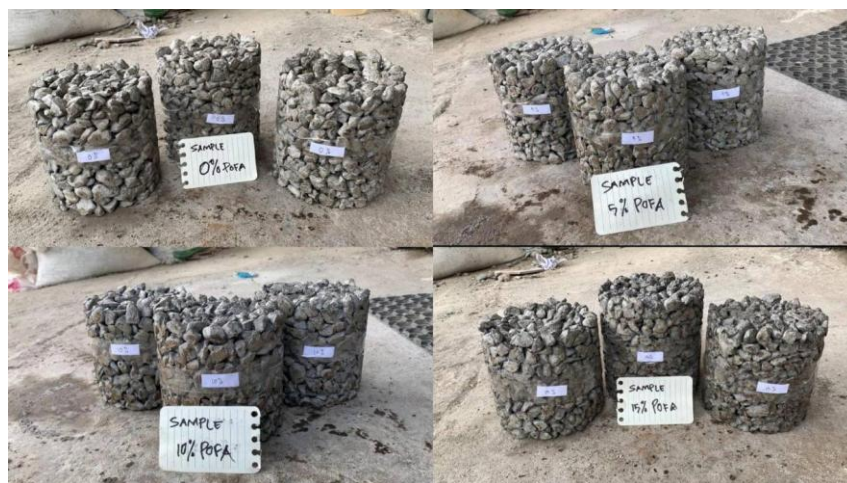
Gambar 5. Sampel Permeabilitas Beton Porous Substitusi POFA Terhadap Berat Semen