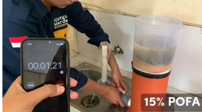
Gambar 2. Pengujian Permeabilitas Sederhana

Pengujian infiltrasi dalam permeabilitas beton porous dilakukan untuk mendapatkan kinerja beton porous dalam meloloskan air. Pengujian infiltrasi dilakukan dengan cara menuangkan volume air tertentu ke permukaan sampel beton porous dan diukur waktunya [12]. Pengujian permeabilitas beton porous pada penelitian ini menggunakan prinsip Falling Head Permeability dengan alat sederhana yang dibuat sendiri mengikuti contoh pada Report ACI 522R-10.