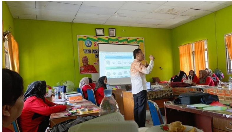
Gambar 3. Tahap Sosialisasi dan Audiensi

Hasil pengamatan menunjukkan bahwa mayoritas guru masih kurang memahami konsep P5, terutama soal peran guru sebagai fasilitator dan bagaimana alur perencanaan proyek berjalan. Dalam sesi diskusi, para guru mendapatkan pemahaman yang lebih baik mengenai prinsip Kurikulum Merdeka, pentingnya penguatan karakter, serta manfaat mengimplementasikan P5 untuk meningkatkan kemampuan sosial dan emosional siswa. Sikap guru yang terbuka dan antusias menunjukkan bahwa mereka membutuhkan bimbingan yang nyata dalam menerapkan P5.