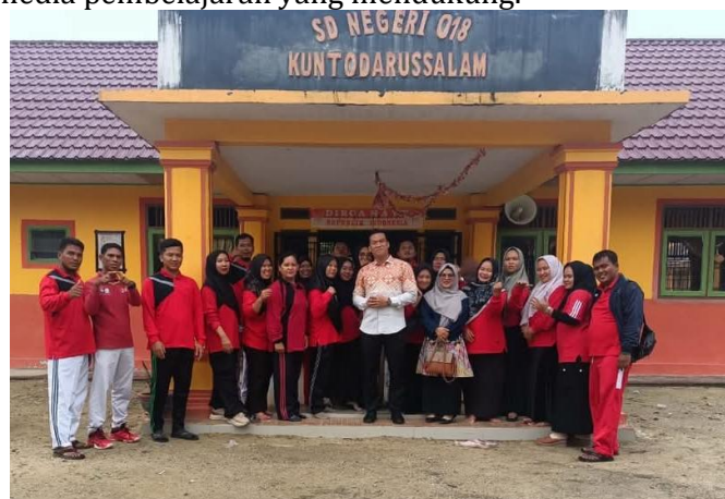
Gambar 2. Kunjungan ke SD Negeri 018 Kunto Darussalam

Pada awal kegiatan, koordinasi dengan pihak sekolah berjalan lancar, terlihat dari adanya surat izin kegiatan serta tersedianya fasilitas seperti ruang belajar, alat presentasi, dan media pembelajaran yang mendukung.