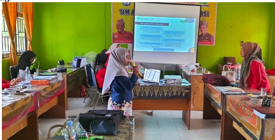
Gambar 4. Tahap Pendampingan

Tahap berikutnya adalah pelaksanaan kegiatan pendampingan, yang merupakan bagian terpenting.