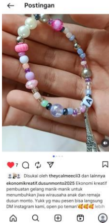
Gambar 5. Promosi melalui media sosial

sosial, menulis deskripsi produk yang informatif dan menarik, pentingnya menjaga interaksi dengan calon pembeli melalui komentar dan pesan, membuat Pamflet Promosi yang menarik di Akun media sosial.