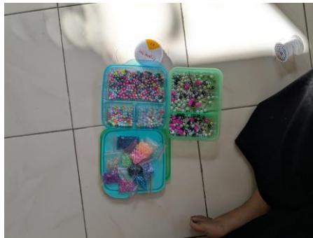
Gambar 3. Bahan Praktik Pembuatan Gelang

Selama proses berlangsung, peserta dibantu secara langsung untuk memastikan setiap anak memahami teknik dasar dan mampu menyelesaikan karyanya dengan baik. Selain itu, nilai-nilai seperti ketelitian, kesabaran, dan tanggung jawab terhadap hasil karya juga ditekankan dalam sesi ini.