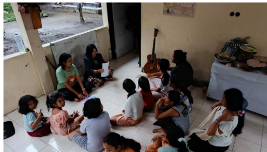
Gambar 10. Evaluasi

Berdasarkan hasil evaluasi yang dilakukan melalui observasi, sesi tanya jawab, dan penilaian terhadap hasil karya peserta, program pelatihan ekonomi kreatif dalam pembuatan gelang manik-manik di Dusun Monto dinilai berhasil mencapai tujuannya. Hasil pre-test dan post-test menunjukkan adanya peningkatan pemahaman peserta terhadap konsep ekonomi kreatif sebesar 75%, dari semula rata-rata 45% sebelum pelatihan menjadi 80% setelah pelatihan. Selain itu, anak-anak menunjukkan antusiasme tinggi selama kegiatan berlangsung, yang terlihat dari keaktifan mereka dalam berdiskusi dan keterlibatan penuh dalam sesi praktik. Sebagian besar peserta mampu memahami konsep dasar ekonomi kreatif serta manfaat memiliki jiwa kewirausahaan sejak dini. Mereka juga dapat menjelaskan kembali materi yang telah disampaikan dan menyebutkan contoh produk kreatif yang relevan dengan lingkungan sekitar mereka.