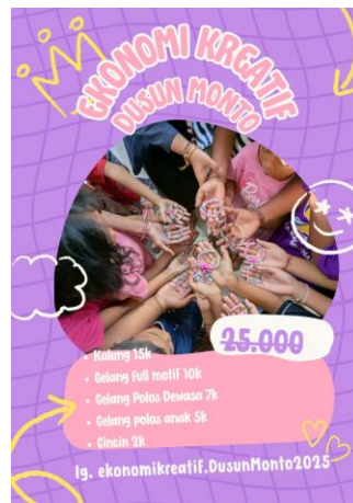
Gambar 6. Pamflet Promosi