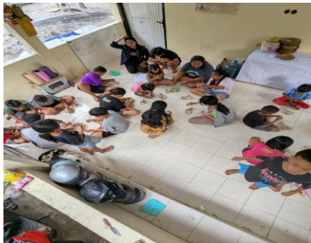
Gambar 4. Proses praktik Pembuatan Gelang