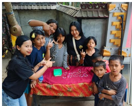
Gambar 7. Penjualan pada saat PENSI

Meskipun peserta sebagian besar masih anak-anak dan remaja, materi disampaikan secara ringan dan visual, agar mudah dipahami. Kegiatan ini bertujuan agar peserta