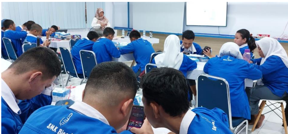
Gambar 2. Siswa/siswi SMKN 10 Makassar mengikuti evaluasi yang diberikan

Berdasarkan hasil evaluasi berbasis skala likert (1-5) untuk 10 indikator pada 30 siswa SMKN 10 Makassar menunjukkan adanya peningkatan signifikan pada sebagian besar indikator kewirausahaan setelah siswa mengikuti pelatihan. Sebelum pelatihan, skor rata-rata indikator cenderung rendah, terutama pada aspek manajemen keuangan (1,80), implementasi usaha (1,70), serta identifikasi peluang usaha (2,00). Hal ini menggambarkan bahwa siswa SMK relatif awam dalam memahami konsep dasar kewirausahaan, meskipun memiliki keterampilan digital yang lebih baik (4,10). Kondisi tersebut sejalan dengan karakteristik generasi muda yang akrab dengan teknologi, tetapi belum terbiasa mengaplikasikannya dalam konteks kewirausahaan. Ketimpangan ini menegaskan pentingnya pelatihan yang sistematis untuk meningkatkan pemahaman mendasar, sehingga kemampuan digital dapat terintegrasi dengan keterampilan bisnis.