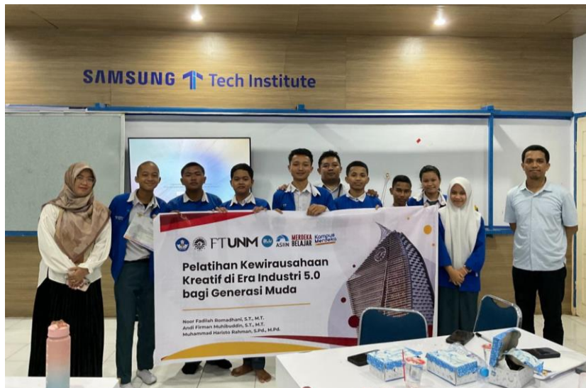
Gambar 4. Foto bersama peserta dan tim pemateri

Berdasarkan grafik pada Gambar 3 terlihat adanya peningkatan yang cukup signifikan pada hasil evaluasi pelatihan kewirausahaan secara umum berdasarkan total capaian 10 indikator. Sebelum pelatihan, capaian siswa berada pada kisaran 48% dari skor maksimal, yang menunjukkan pemahaman dan keterampilan kewirausahaan mereka masih relatif rendah. Setelah mengikuti pelatihan, nilai evaluasi meningkat menjadi sekitar 65,4% dari skor maksimal, mencerminkan adanya penguatan pemahaman konsep dasar, motivasi, serta keterampilan praktis kewirausahaan. Peningkatan ini membuktikan bahwa program pelatihan yang dilakukan di sekolah efektif dalam