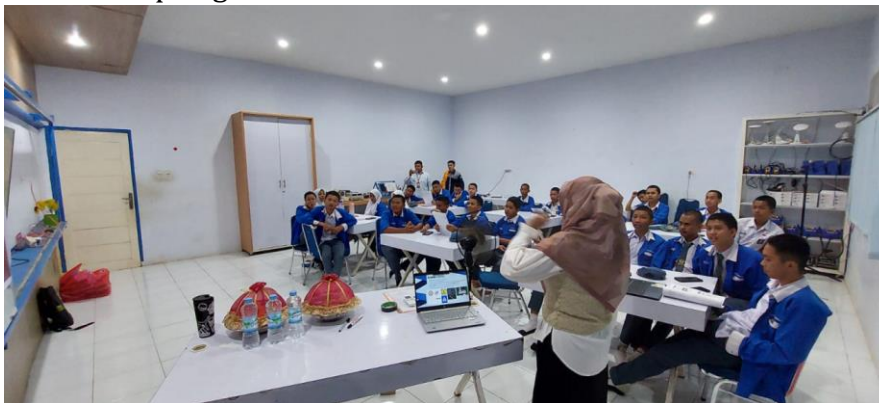
Gambar 1. Penyampaian materi kepada siswa/siswi SMKN 10 Makassar

Pelatihan kewirausahaan bagi siswa/siswi SMKN 10 Makassar ini terlaksana dengan baik di lingkungan sekolah sebagai respon terhadap menariknya pembahasan tentang dunia bisnis utamanya bisnis di era digital dengan dihadiri sebanyak 30 siswa/siswi jurusan teknik komputer jaringan. Kegiatan disampaikan melalui penyampaian materi dan inovasi terkait kewirausahaan yang dipadukan dengan diskusi partisipatif, sehingga mendorong interaksi aktif dan keberanian peserta menyampaikan rasa keingintahuannya. Hasil pelatihan ditunjukkan antara lain melalui tingginya antusiasme peserta, sebagaimana tergambar pada Tabel 1 yang merepresentasikan respons positif terhadap kegiatan sosialisasi literasi kewirausahaan di era industri 5.0.