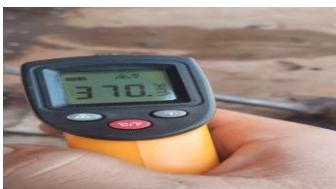
Gambar 3. Suhu yang di hasilkan kompor bahan bakar oli bekas

Temperatur api yang dihasilkan oli bekas memiliki perbedaan kurang lebih 200 °C dengan gas elpiji yang notabene adalah bahan bakar. Api yang dihasilkan oli bekas berwarna jingga sedangkan elpiji biru, hal ini disebabkan karena elpiji merupakan bahan bakar dengan pembakaran sempurna. [7]. Dengan bbo(bahan bakar oli) sebanyak 100 mili membutuhkan hingga 31 menit agar oli dapat habis, Suhu mencapai hingga 430 °c