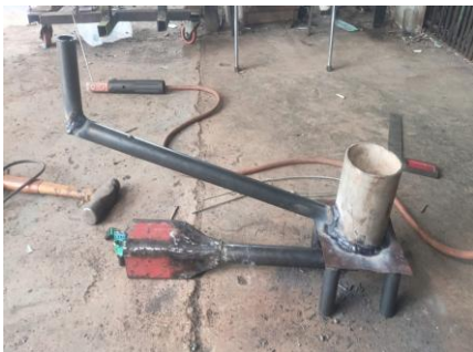
Gambar 5. Bentuk alat setelah finising dan siap untuk di uji kegunaannya