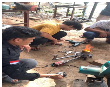
Gambar 1. Hasil uji alat setelah jadi

Pengujian dilakukan dengan melakukan variasi jumlah lubang bunner 16 lubang, 20 lubang, 24 lubang [5]. Adapun data yang diambil dari penelitian ini yaitu jumlah bahan bakar yang digunakan, warna nyala api dan temperatur pembakaran serta efisiensi kompor. Pengujian kompor dilakukan dengan variasi laju aliran udara 9 m/s, 10 m/s, dan 11 m/s [6].