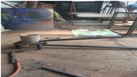
Gambar 4. Bentuk alat setengah jadi masih perlu beberapa perbaikan yaitu pengelasan, pemotongan, dan finising

Pada tahap evaluasi, peserta antusias mengikuti pelatihan. Berdasarkan diskusi selama pelatihan dilaksanakan, diketahui bahwa sebagian besar peserta baru mengetahui bahwa oli motor bekas dapat dimanfaatkan dengan dibakar langsung. Proses pembuatan tungku terasa sulit pada awalnya, namun menjadi mudah ketika dilakukan berulang-ulang [10].