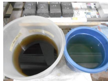
Gambar 6. Air Gambut