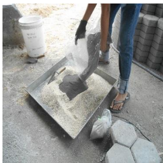
Gambar 1. Pencampuran Bahan

Material yang digunakan (abu sawit, agregat halus, natrium hidroksida, natrium silikat, add water , dan superplasticizer ) ditimbang sesuai dengan komposisinya. Agregat halus yang digunakan harus dalam kondisi SSD (saturated surface dry) . Abu sawit yang digunakan adalah abu sawit lolos saringan no. 200, sehingga harus dilakukan proses penyaringan terlebih dahulu sebelum proses pencampuran paving block geopolimer.