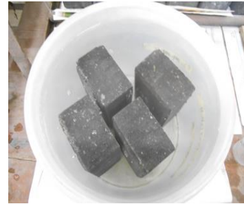
Gambar 5. Hasil Pengujian Absorpsi

Dari data hasil pengujian absorpsi yang didapat, hasil pengujian absorpsi berbanding terbalik dengan hasil pengujian kuat tekan. Sehingga pengujian kuat tekan dan absorpsi ini mempunyai kaitan satu sama lainnya.