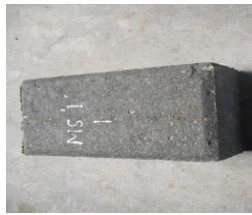
Gambar 3. Paving Block 20x10x6 cm

ada faktor kimia yang terjadi antara semen dan air gambut. Faktor kimia yang berpengaruh tidak diteliti lebih lanjut.